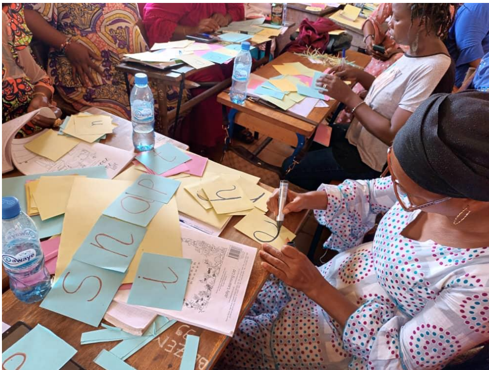
Stagiaire créant des flashcards