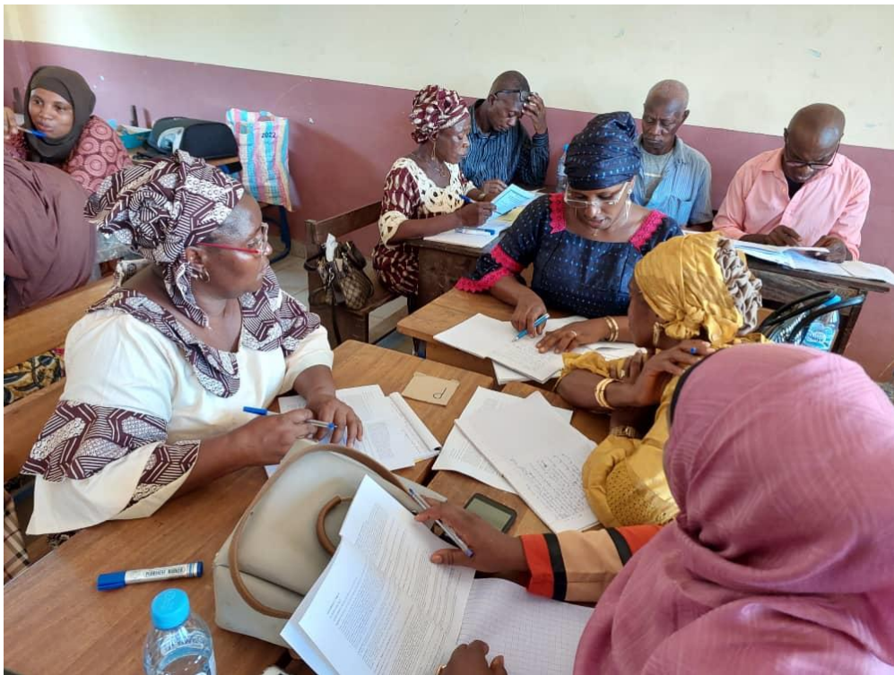
Concertation des participants pour présenter des « s »