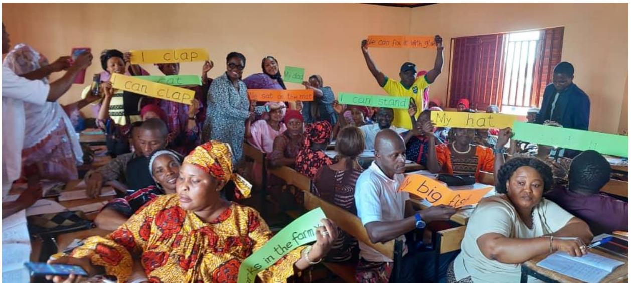
Les participants à Kindia écrivent des phrases simples en utilisant les 42 sons et les mots délicats