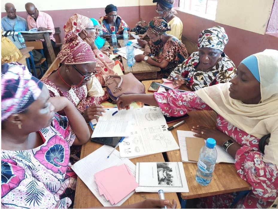
Les participants découvrent comment utiliser les élèves livre 1