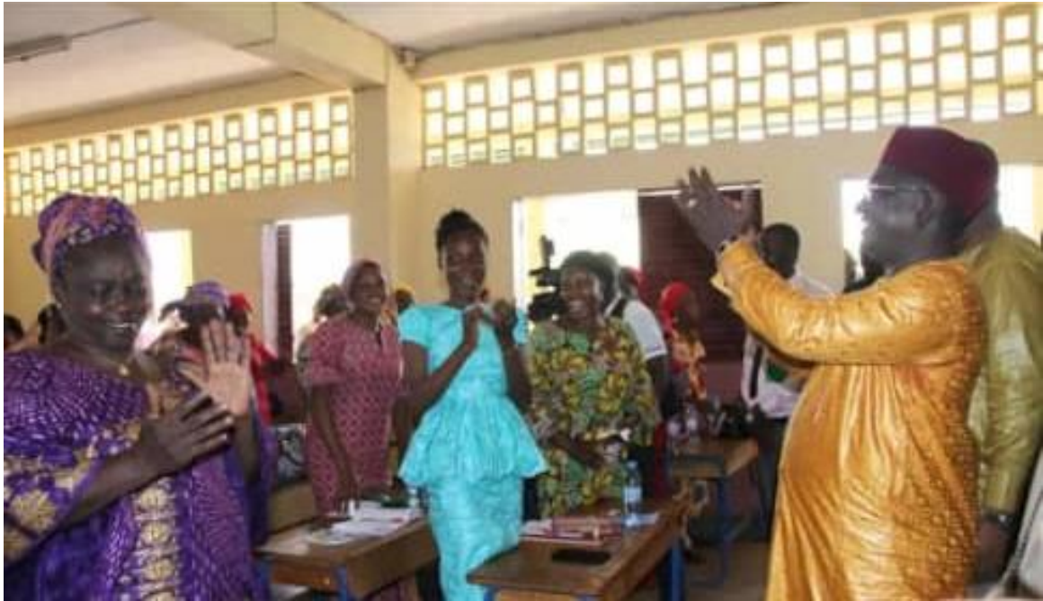
Le ministre s'adresse aux participants