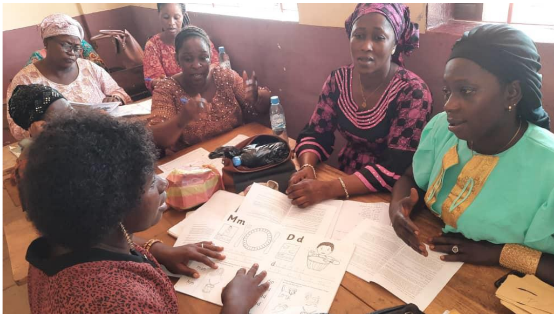
Participants en groupe se préparant à présenter « d »