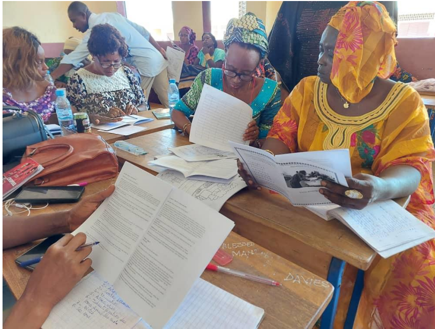
Les participants se familiarisent avec le guide de l'enseignant Français