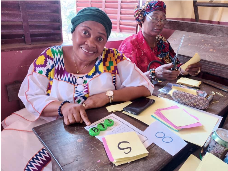
Stagiaire mélangeant des sons pour lire le mot « cochon »