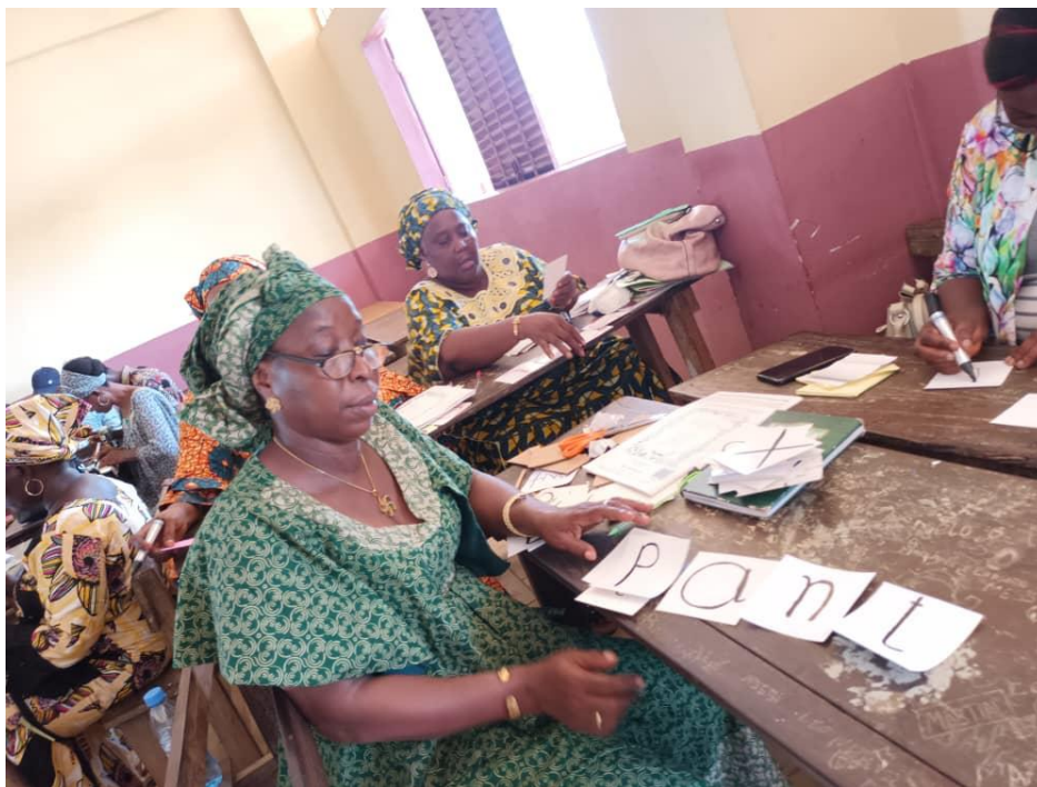
Un participant mélange des sons sur des cartes mémoire pour lire « pantalon »