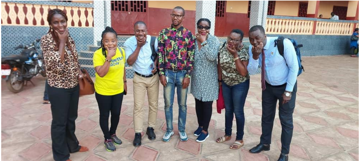
Trainers and Chief of Mission doing it the Jolly way