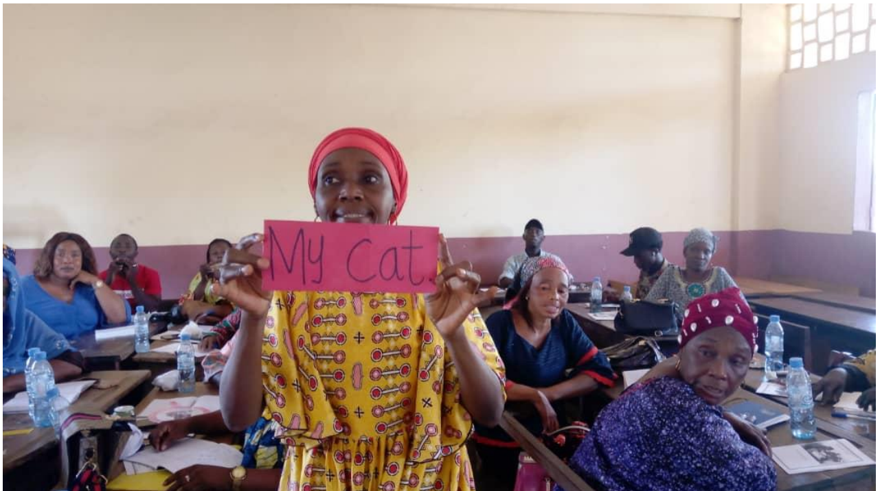
Stagiaire faisant des phrases simples sur du carton