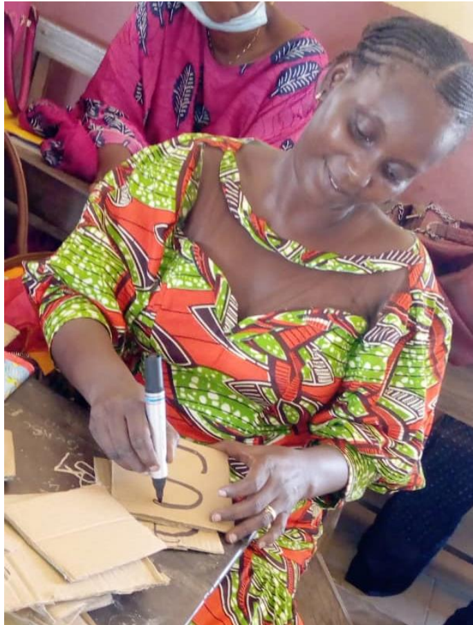
Participante créant ses flashcards