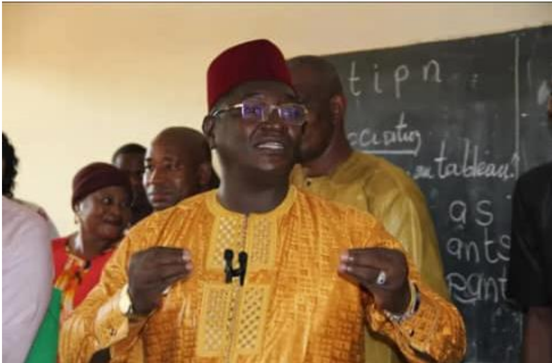
Le ministre encourage les participants à donner le meilleur d'eux-mêmes