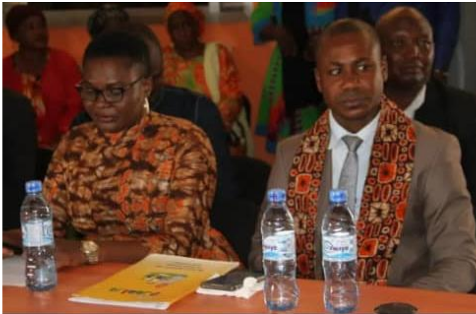
Experts Jolly Phonics du Nigeria et de Côte d'Ivoire