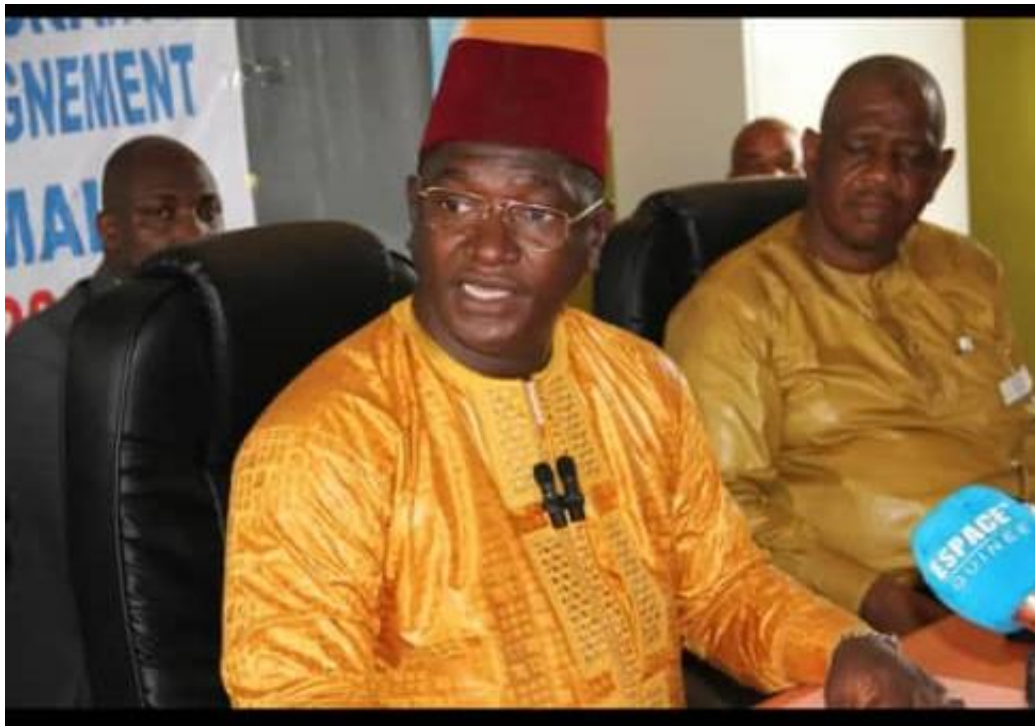
Le ministre de l'Enseignement élémentaire et de l'Alphabétisation lors de son discours