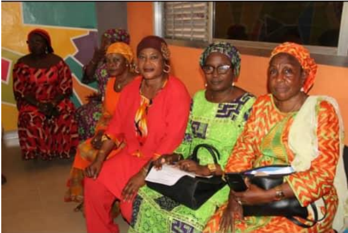
Personnel du directeur national participant à la formation