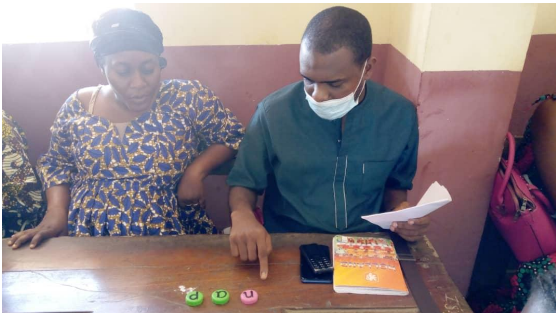
Les stagiaires utilisent des couvercles de bouteilles pour mélanger les sons et lire « sieste »