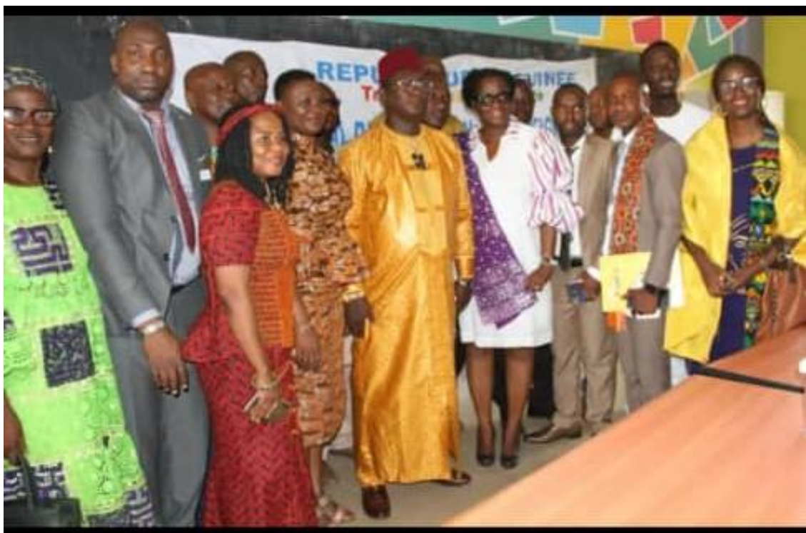
Le ministre (au centre), les experts de Jolly Phonics et le ministre Staff