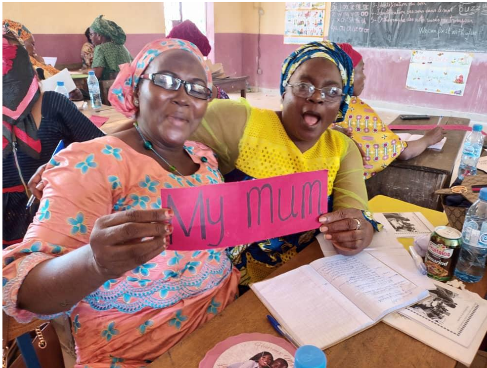
Stagiaires faisant une phrase simple sur du carton