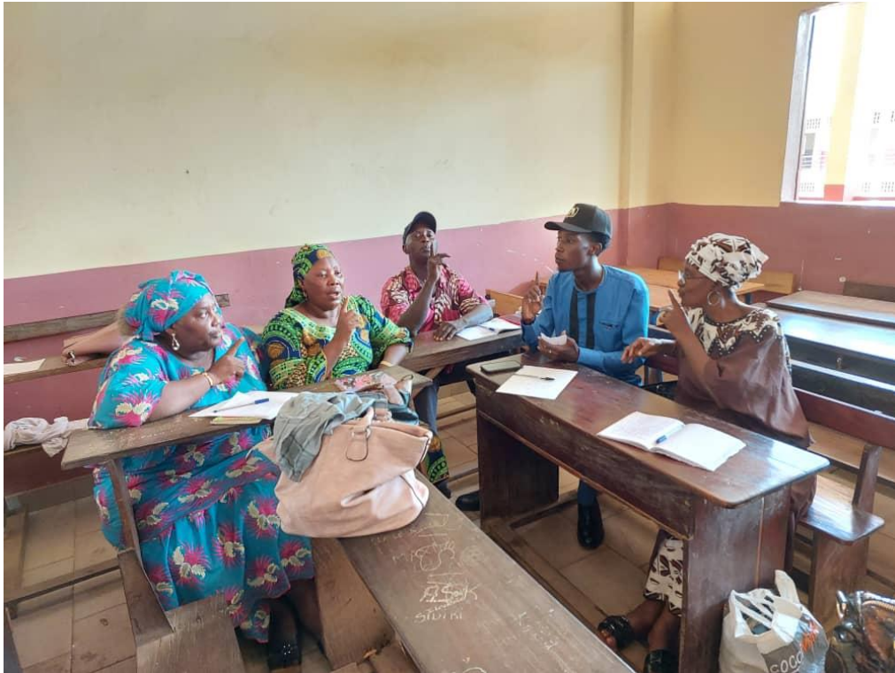
Stagiaires en groupe pratiquant « p » avec action